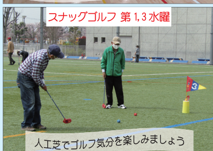
スナッグゴルフ 第1,3水曜