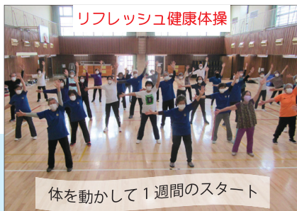
リフレッシュ健康体操