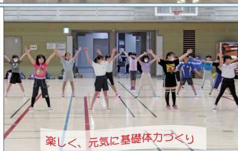
楽しく、元気に基礎体力づくり