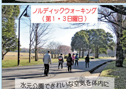
ノルディックウォーキング (第1・3日曜日)