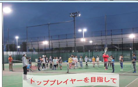
トッププレイヤーを目指して