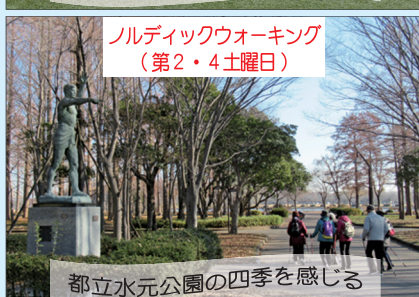
ノルディックウォーキング (第2・4土曜日)