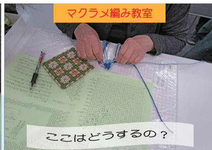
マクラメ編み教室