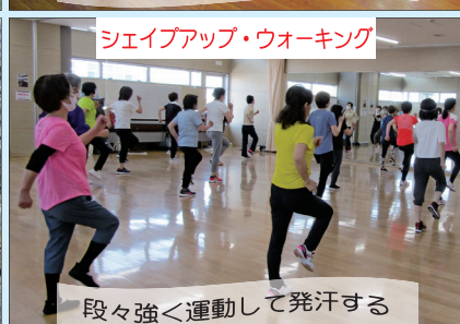
シェイプアップ・ウォーキング