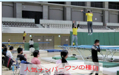
人気ナンバーワンの種目