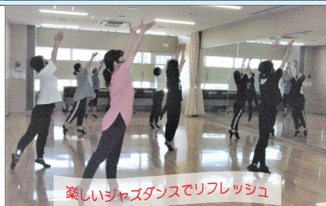
楽しいジャズダンスでリフレッシュ