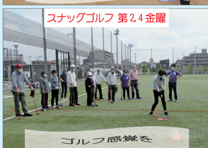
スナッグゴルフ 第2,4金曜