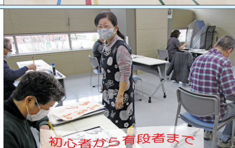
初心者から有段者まで