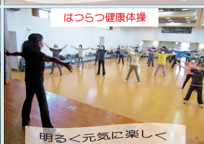
はつらつ健康体操