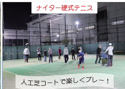
ナイター硬式テニス