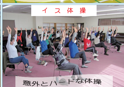
イ ス 体 操