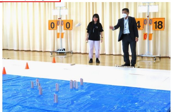
新種目のモルック