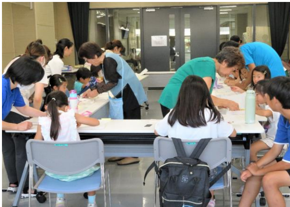
細かい作業をピンセットで