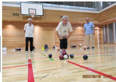
ジャックボール（白色）の上にON

都立小合学園体育館や水元特別支援学校体育館等、広いスペース・空調完備で快適にプレーできます。