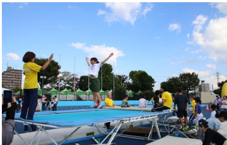
昨年のかつしかスポーツフェスティバル奥戸会場風景