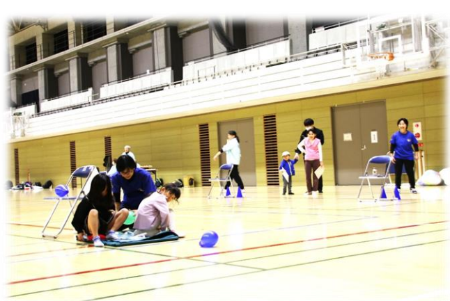
軽い為？風船が中々割れません!?