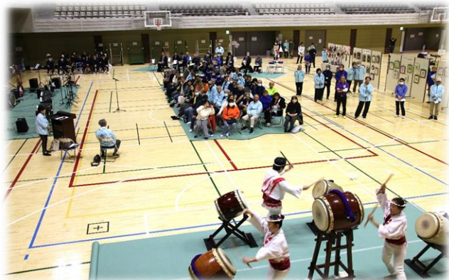
迎え太鼓で盛り上げ

雨の為、準備していた雨天用のプログラムを屋内施設内で開催。 様々な種目を用意し参加者の皆様にお楽しみ頂きました。