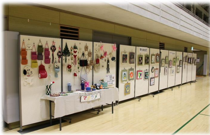
文化系作品の展示