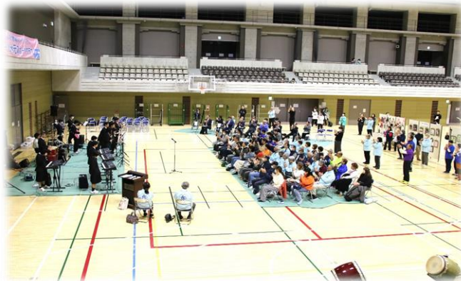
都立水元小合学園音楽部の演奏