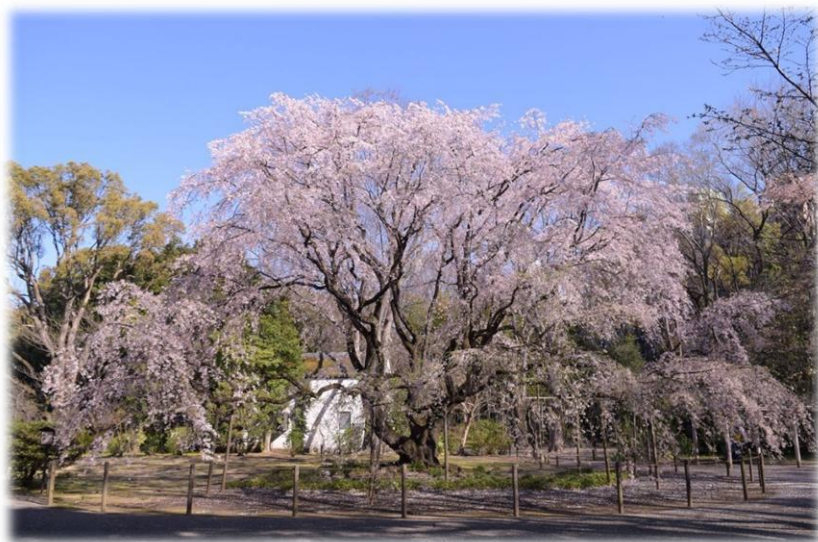
六義園の桜が満開の時