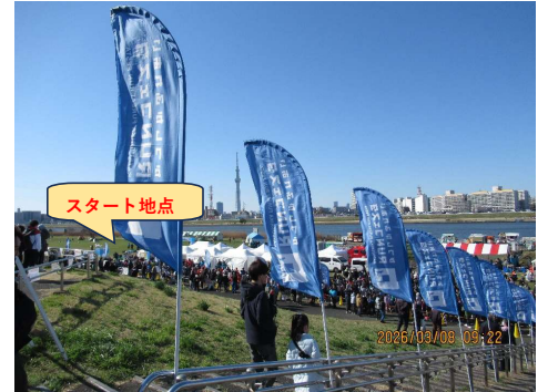
親子レースのスタート風景